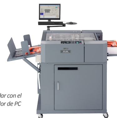
DC-616 PRO estándar con el software Controlador de PC

La versatilidad de la DC-616 y DC-616 PRO la hace ideal para terminar aplicaciones con rebase en un solo paso. Sus refiladoras rotativas, guillotina, hendidora y perforadora (opcional en la DC-616) proporcionan la versatilidad de varias máquinas sin la necesidad de ajustes manuales. Los márgenes son cortados horizontalmente por la refiladora y verticalmente por la guillotina y son automáticamente depositados en la cesta de basura. Solo