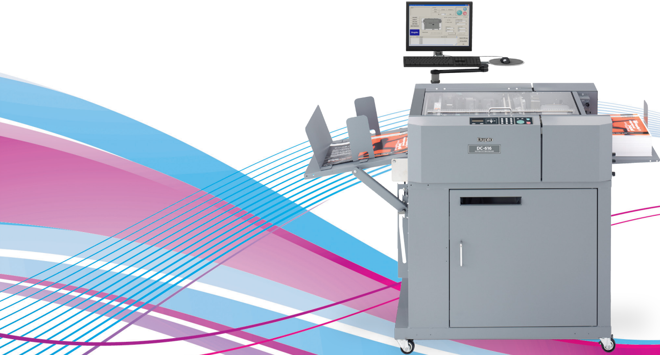
DC-616 Pro (PC y brazo de PC vendido por separado)

Duplo USA Corporation 3050 S. Daimler Street, Santa Ana, CA 92705 tel +1.949.752.8222 fax +1.949.851.3054 www.duplousa.com Derechos reservados. Ninguna parte de este documento puede ser reproducido de manera parcial o total sin previa autorización por parte de Duplo USA Corporation.